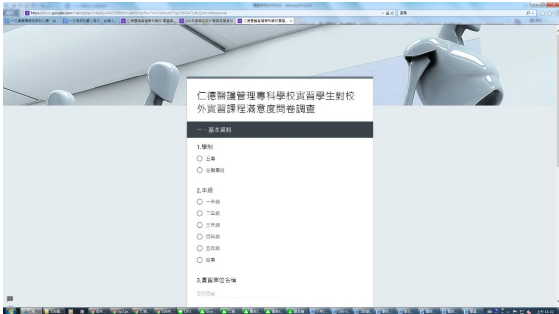
仁德醫護管理專科學校實習學生就業輔導成效滿意度調查