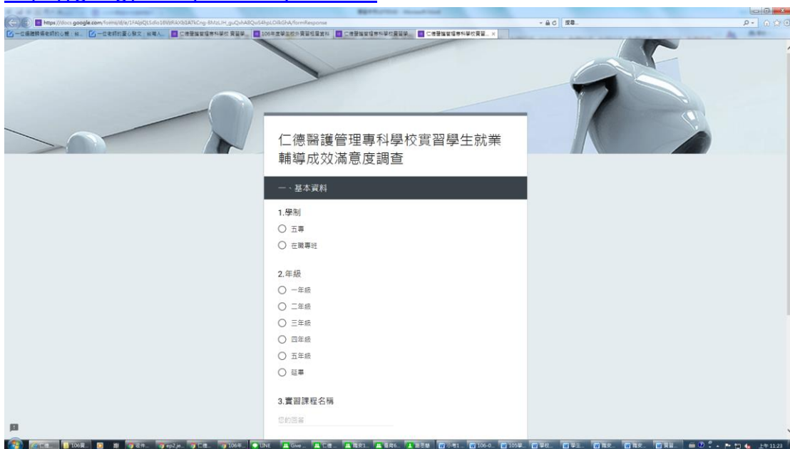
仁德醫護管理專科學校校外實習合作機構對實習課程滿意度問卷調查